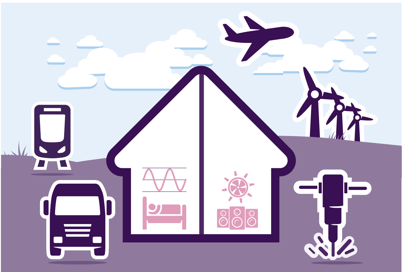
Figuur 2. LFG-bronnen in en om het huis (oorspronkelijke bron: Baliatsas en anderen, 2016)