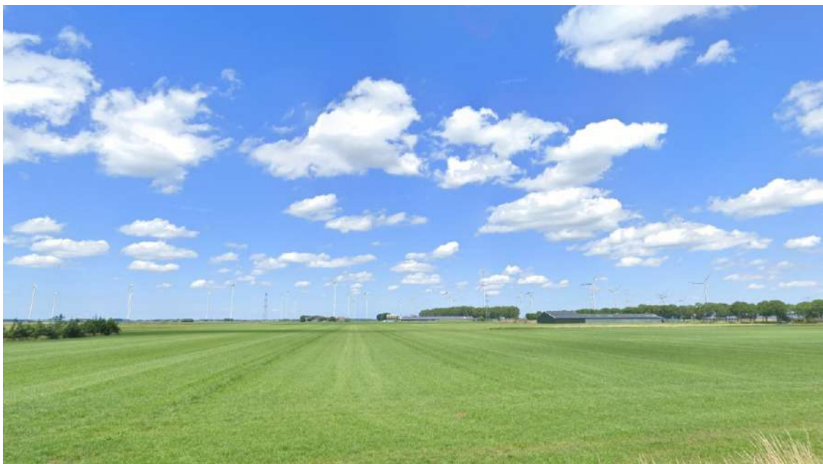
Afbeelding 4.1 Visualisatie voorbeeldopstelling 2_1.1 Basis